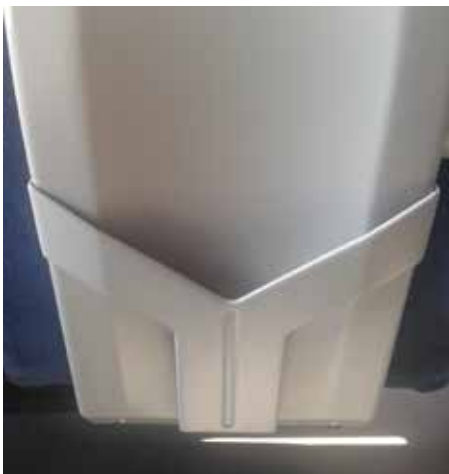
Sampling - ulotki przy siedzeniach pasażerów, format A4