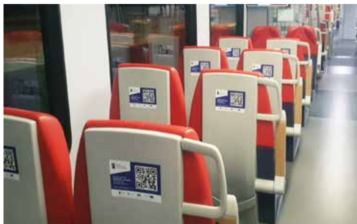
Naklejka na oparciu fotela, maks format A5.